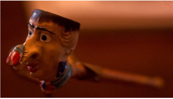
Afb. 6. Rodge-Nez pijp. Nimy, Nihoul, eind 19e – begin 20e eeuw.