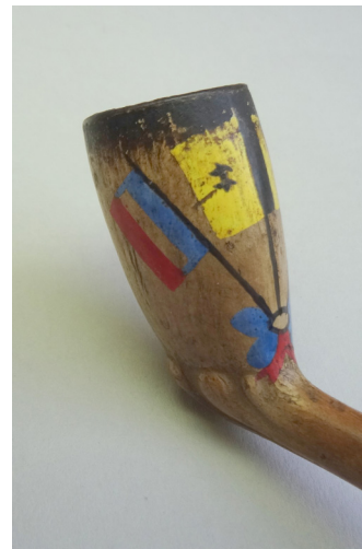
Afb. 12a-d. Pijp met steelopschrift Vive L'Union en Droit pour Tous. Nimy, Nihoul, 1915.