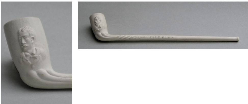
Afb. 4. Falleur en Schmidt. Kortrijk, De Bevere, midden 20e eeuw.