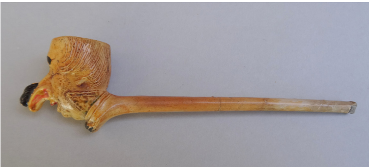
Afb. 8. Rodge-Nez pijp. Weert, Trumm-Bergmans, eind 19e – begin 20e eeuw.