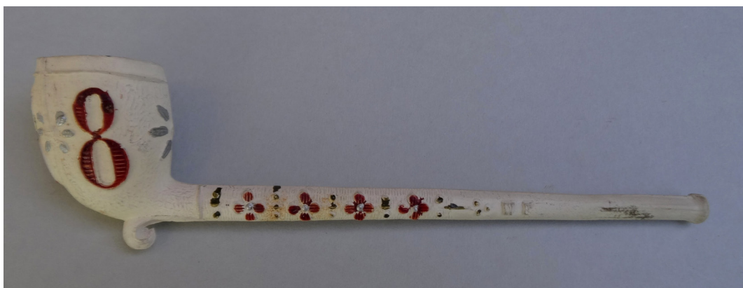
Afb. 5. Pijp met op de kop drie maal een acht: Acht uren werken, acht uren rust en acht uren slapen. Chokier, Wingender Frères.