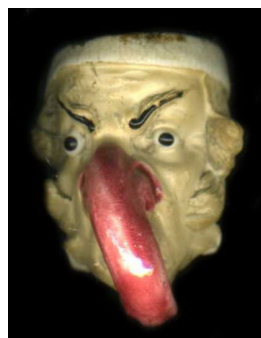
Afb. 10a-b. Rodge-Nez pijp. Noord-Frankrijk, onbekende fabrikant, 1870-1880.