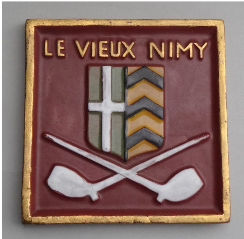
Tegeltje, waarop het belang van de pijpenindustrie voor Nimy is uitgedrukt, door onder het stadswapen twee pijpen af te beelden. In Nimy waren ondermeer Nihoul (1825-1881) en Scouflaire (1844-1918) gevestigd. Datering onbekend.