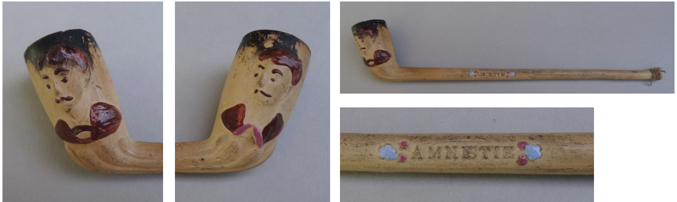
Afb. 3a-d. Falleur en Schmidt. Nimy, Nihoul, 1886-ca1900.