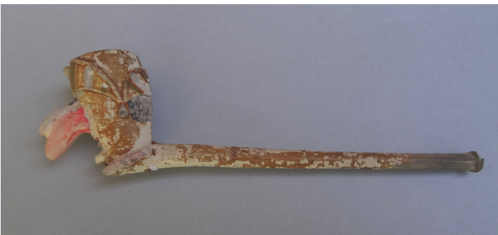
Afb. 9. Rodge-Nez pijp. Chokier, Wingender Frères, 1913.