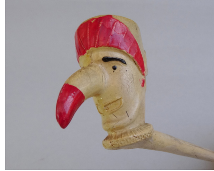
Afb. 7. Rodge-Nez pijp. Bree, Knoedgen, eind 19e – begin 20e eeuw.